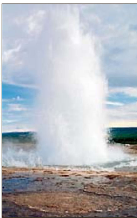
Un geyser in Islanda

E' arrivato a Gardaland un tipo di albero che si credeva estinto da 90 milioni di anni