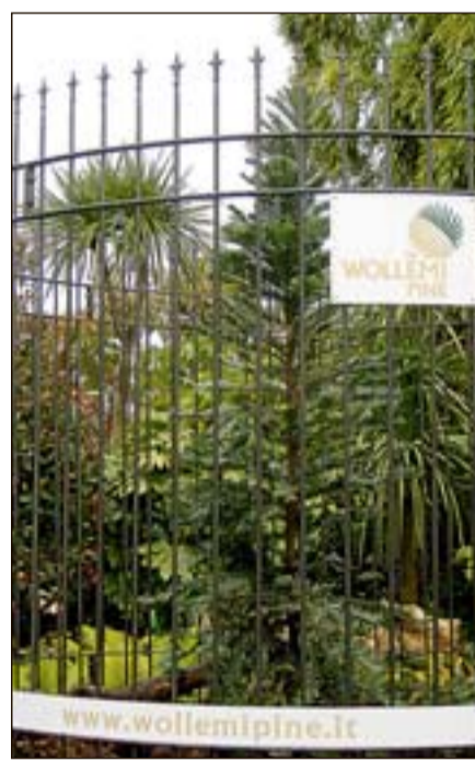
Il Wollemi Pine nel parco di Gardaland

Si tratta di una maestosa conifera, caratterizzata da aghi particolari ed enormi, così come è particolare anche la sua struttura di ramificazione, simile a quella di una palma. La corteccia è lucida e bollosa. Il più grande esemplare rinvenuto (The Bill Tree) è alto più di 40 metri e ha un diametro di 120 cm. Si trova tutt'oggi in una gola segreta del Wollemi National Park. Ed è il «genitore» dell'esemplare esposto a Gardaland, nato all'interno del Wollemi National Park, zollato in loco e trasportato direttamente in Italia. Il riconosciuto amore per il verde di Gardaland e il sapiente lavoro dei suoi scenografi, permettono ora agli ospiti del parco di ammirare un esemplare davvero straordinario e unico.