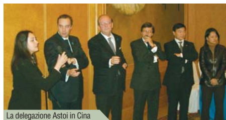
La delegazione Astoi in Cina

■ Con una promozione Alitalia e Tim, fino al 23 dicembre si potrà acquistare a un unico prezzo un biglietto di andata e ritorno per volare in Italia o in Europa (da emettere con biglietto elettronico) e una scheda servizi Tim composta da 500 minuti di traffico, 500 sms e 500 mms. I due prodotti potranno essere utilizzati dal 15 gennaio al 15 marzo 2005 e prevedono tariffe a partire da 75 euro.