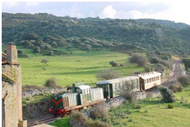
Un Sardo in giro: il trenino verde!