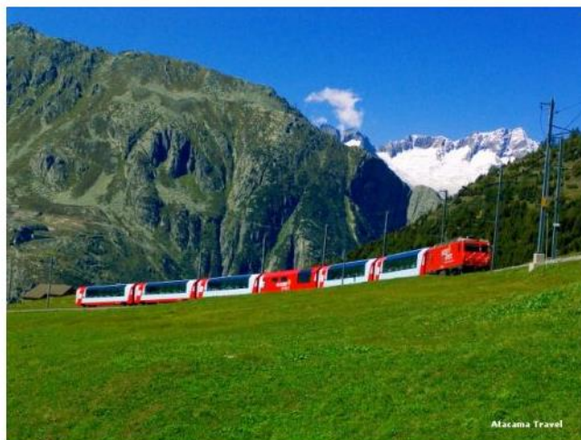
Bernina Express: Tirano - St Moritz

"Odio i treni che partono. Anche quelli che arrivano. Non sopporto le partenze; ma nemmeno gli arrivi e i ricongiungimenti, perché vuol dire comunque che un distacco c'è stato: mi prende un groppo in gola, forse più ancora se il treno arriva, che non se sta partendo." Paola Mastrocola, Più lontana della luna, 2007