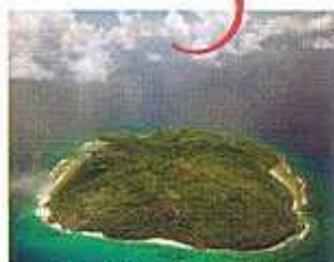
Una veduta aerea della minuscola Frégate Island

Temperatura 23°C-30°C mare 26°C-28°C piogge 5 gg fuso + 2 ore volo 8 ore