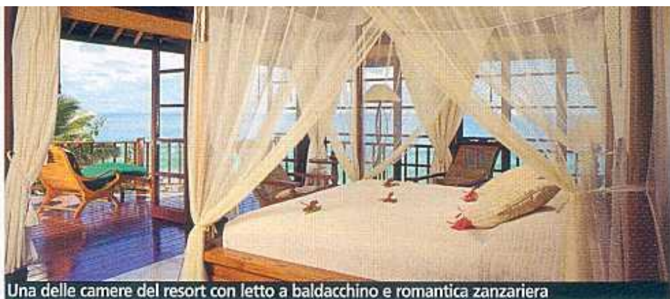
Una delle camere del resort con letto a baldacchino e romantica zanzariera

La piccola isola privata dell'arcipelago ha 7 spiagge candide, definite dal London Times le più belle del mondo, e un solo resort con 16 lussuose ville sull'oceano